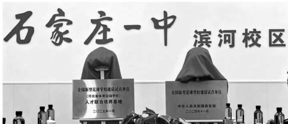
2025年1月23日,河北省全国新型足球学校建设试点单位和人才联合培养基地揭牌仪式在石家庄市第一中学滨河校区举行。

如今的河北足球,在体系建设层面走得更扎实;在青训中心建设层面,河北足球一直在扎实地推进;在新型足球学校建设及整体的系统推进方面,河北省更是走在了全国的前面,不管是新型足球学校,还是3+4中职至本科的贯通体系,河北省都在全国范围内有着示范意义;在社会足球层面,面对城市联赛的汹涌浪潮,河北省主打五人制联赛,独辟蹊径,也取得了不错的效果。当然,从长远的发展来看,河北省仍旧需要建立通俗的城市联赛体系,进一步激发基层的热情和潜力。