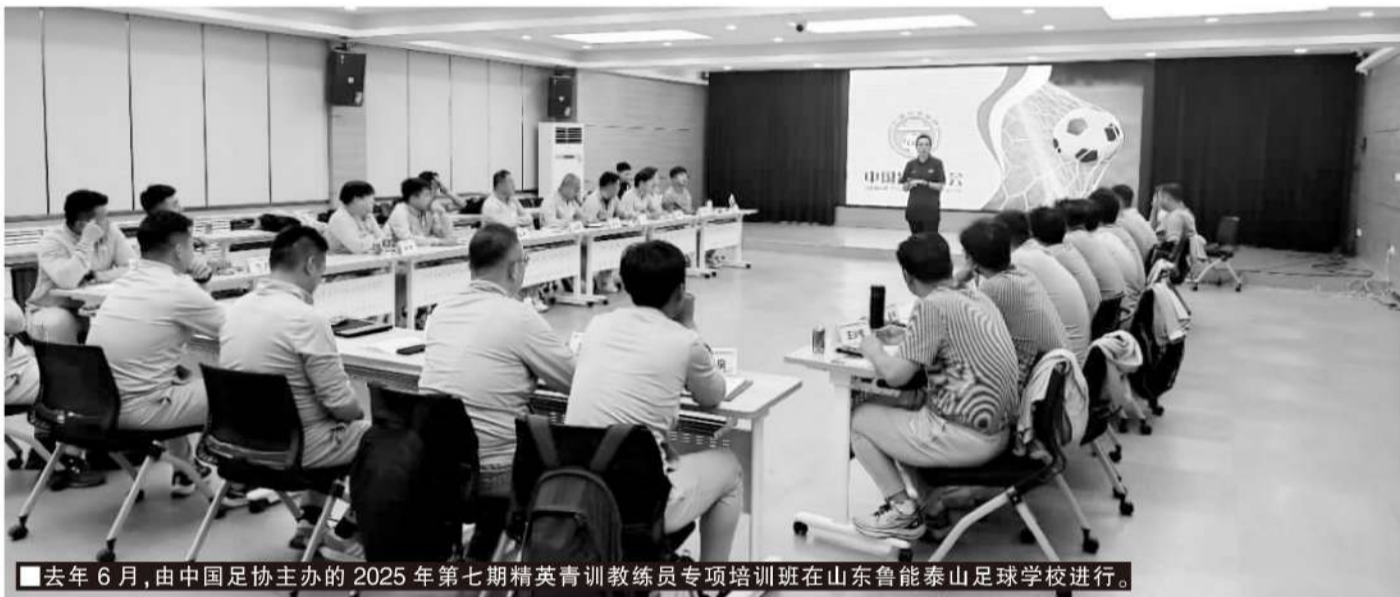
去年6月,由中国足协主办的2025年第七期精英青训教练员专项培训班在山东鲁能泰山足球学校进行。

综上,在五级青训中心逐步成型的同时,有关部门更应该清楚地认识到目前我国精英青训教练的巨大缺口,需要依托各级青训中心的硬件配置,加大力度培养青训教练,从根本上改变目前优质基层教练严重缺失的现状。