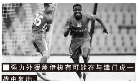
强力外援盖伊极有可能在与津门虎一战中复出。

从各方面的信息看，津门虎防线目前严重人员不整。外援科尔多瓦脚踝韧带损伤程度比较严重，预计恢复时间在一个月