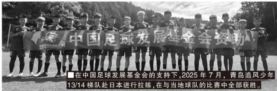
在中国足球发展基金会的支持下,2025年7月,青岛追风少年13/14梯队赴日本进行拉练,在与当地球队的比赛中全部获胜。

培养优秀的青少年足球人才,专业教练的引领作用无可替代。作为青岛追风少年俱乐部的核心领路人,曲波的职业足球